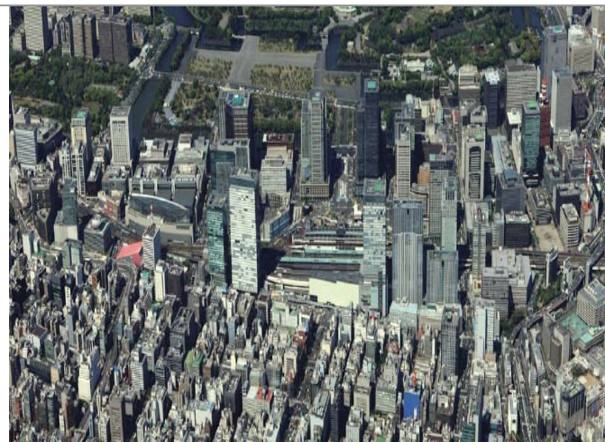
丸の内・大手町・有楽町地区・写真と地図