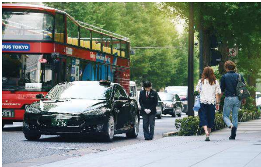
TESLA Model S (電気自動車)